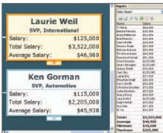
Eine dynamische Berichterstattung ermöglicht die Erstellung von Berichten der Organigramm Daten, testen von „Was-Wäre-Wenn“-Szenarien sowie die Visualisierung des potentiellen Budgets oder der Mitarbeiterzahl nach Organigrammzweig.